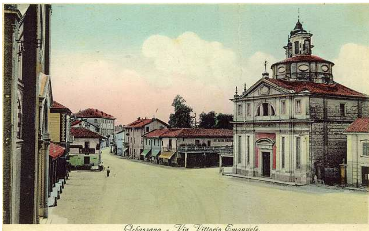
Orbassano - Via Vittorio Emanuele.