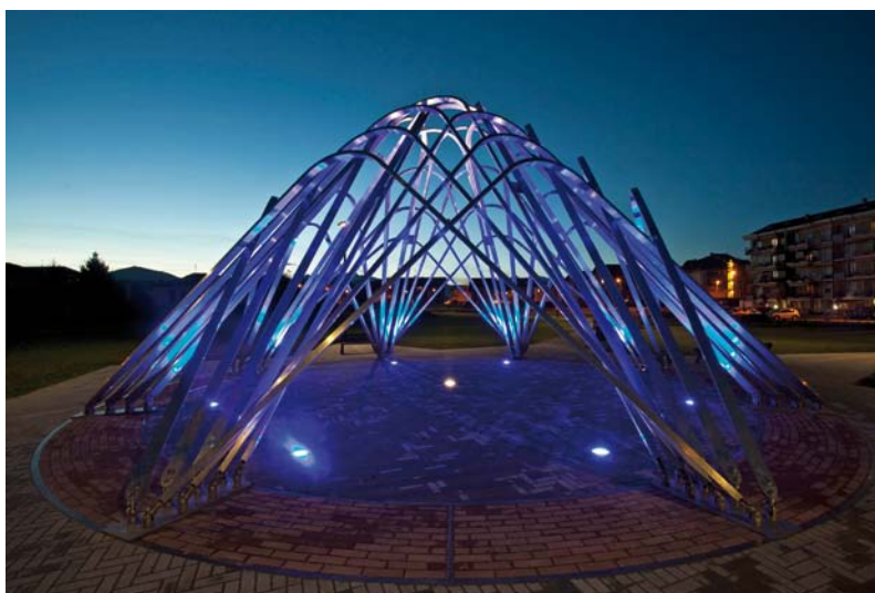
Parco Orsa Minore

Il Parco dell'Orsa Minore è reso particolare dall'architettura che richiama la Costellazione dell'Orsa Minore, suggestiva soprattutto in versione notturna, mentre il Parco Primo Nebiolo, conosciuto anche come "Parco del Podista", ogni giorno viene utilizzato da sportivi, appassionati di fitness e benessere, cittadini desiderosi di trascorrere alcune ore all'aria aperta.