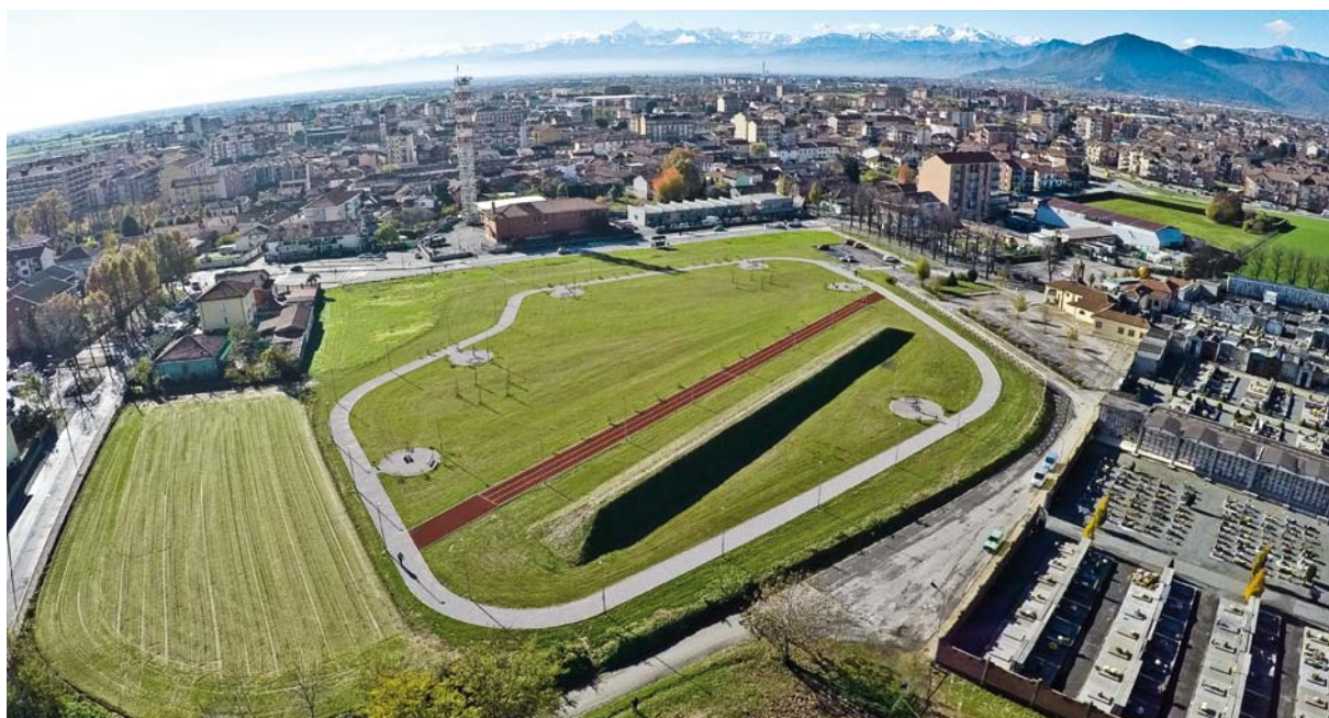
Parco Primo Nebiolo