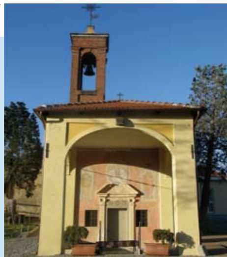
Cappella del cimitero: conclusi i lavori

I lavori in oggetto sono stati realizzati con la supervisione della Soprintendenza ai Beni Architettonici del Piemonte.