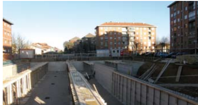
Via Coppino: cantiere dei box interrati

In questi casi sono complesse le procedure di riavvio dei lavori. Per la realizzazione dell'essiccatoio nella zona dell'ex autocentro, il Comune sta gestendo una situazione di fallimento della ditta aggiudicataria. Si è conclusa anche la bonifica della discarica di Garosse - Gonzole. Entro l'estate verranno ultimati i lavori dei box di via Coppino.