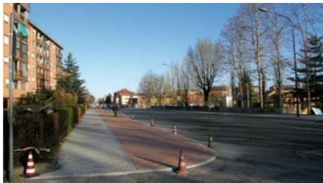
Via Frejus: primi marciapiedi conclusi