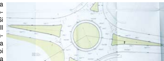
Circonvallazione esterna: incrocio con strada Volvera

E' stato approvato dalla Giunta Comunale il progetto per la realizzazione della nuova rotonda in strada Circonvallazione esterna, all'incrocio tra le Strade Provinciali 6 e 139. Si andrà così a migliorare un incrocio di ingresso alla Città. Il progetto, redatto da una Società di progettazione per conto del Soggetto attuatore del Centro Commerciale di Pasta è stato prima rivisto dalla Nuova Amministrazione e poi approvato dalla Provincia di Torino; prevede una rotonda che eliminerà l'impianto semaforico esistente.