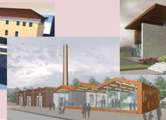
Nuova Biblioteca Civica