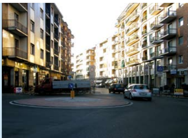
Via Roma: conclusa la rotonda

La rotonda di Via Di Nanni - Str. Torino - Via Calvino è in corso di realizzazione dopo alcune modifiche portate dall'Amministrazione attuale al progetto originale.