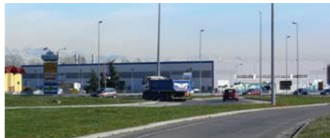
L'area oggetto di intervento

Una modifica che non prevede alcun ampliamento di volumi del fabbricato pre-esistente e che porterà ad una riqualificazione dell'area a parcheggio esistente, oltre ad un consistente incremento di posti di lavoro in prevalenza di cittadini di Orbassano.