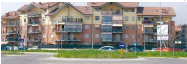
Rotonda "Delle Macine" oggi.

Verranno quindi posizionate due macine recuperate durante i lavori di rifacimento della bialera di via Dei Mulini all'inizio degli anni '90, due macine che ben rappresentano la storicità di quella zona del paese.