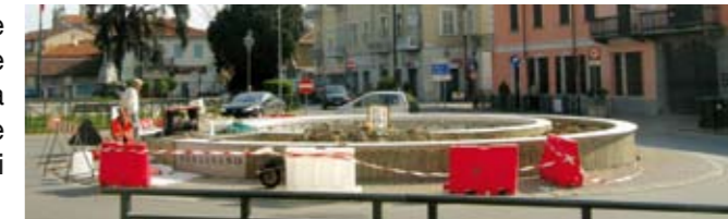
Rotonda di via Frejus, lavori in corso.

Il restyling che l'Amministrazione ha deciso di apportare a questo importante punto di accesso alla Città, consiste nel rivestimento in pietra della fontana per armonizzarla con la vicina area monumentale. La rotonda sarà inoltre abbellita da un messaggio di benvenuto con lo stemma di Orbassano e da una corona floreale adeguata.