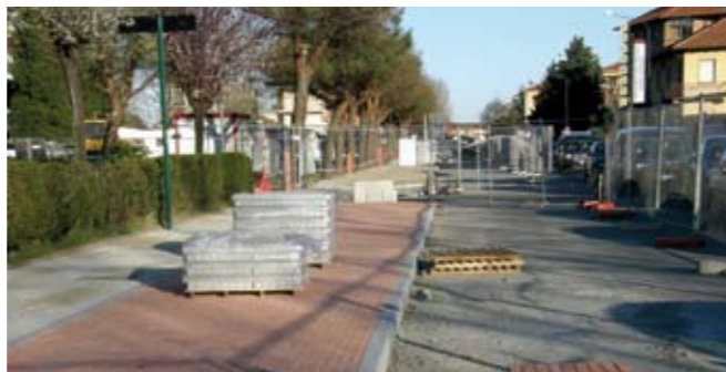
Via Frejus: il cantiere

Il progetto iniziale prevedeva il rifacimento della via, da via Gramsci a via Ascianghi, in due lotti di intervento da realizzarsi in fasi distinte: lotto 1, da via Gramsci a via Giusti, con importo stanziato di 750 mila euro da realizzarsi nel 2008, e lotto 2 da via Giusti a via Ascianghi con importo stanziato di 750 mila euro da realizzarsi nel 2009. Grazie ad una attenta rielaborazione dei lavori in programma, abbiamo realizzato un unico intervento, determinando così un consistente contenimento dei costi (750 mila euro per pressoché la totalità dell'opera), una razionalizzazione delle risorse e un minore disagio per i residenti con l'esecuzione dei lavori in un'unica soluzione, anziché in due fasi distinte, riducendo così le difficoltà dei cittadini. Questa fondamentale arteria della nostra Città sarà così finalmente riqualificata con un'attenzione particolare alla sicurezza di tutti (attraversamenti pedonali protetti, pista ciclabile, rotonda davanti alla scuola, sistemazione con ampliamento del parcheggio davanti alla scuola con area verde di protezione all'entrata e tante altre opere di messa in sicurezza). Verranno inoltre collocati indicatori di velocità e pannelli informativi. E' inoltre impegno di questa Amministrazione realizzare al più presto la parte rimanente sino alla rotonda di strada Piossasco, ultimando così l'ammodernamento di questa importante arteria della Città.