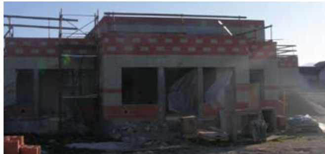
Scuola Gamba: il cantiere della nuova scuola