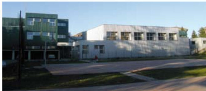
Scuola Fermi: conclusi i lavori alla facciata

E' in fase di progettazione il terzo lotto di interventi per la sistemazione delle aree esterne.