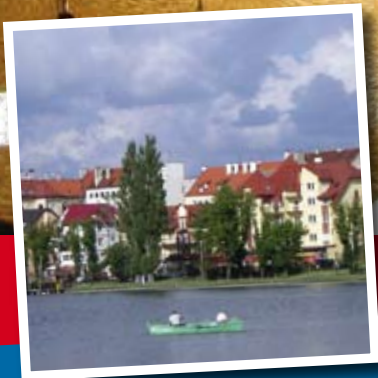
Orbassano e gemellaggi

Registrazione Tribunale di Torino n. 3876 del 14 gennaio 1988