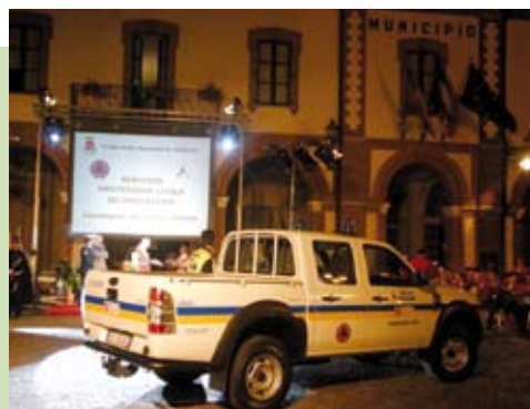
Il nuovo mezzo della Protezione civile

Inoltre, al fine di rendere la squadra completamente efficiente, consentendogli di intervenire con tempestività e in piena autonomia rispetto ad altri enti, è previsto, entro fine anno, l'acquisto di un carrello appendice con generatore e idrovora con deposito di tubi di pescaggio, porta motoseghe, torre faro con tripede.