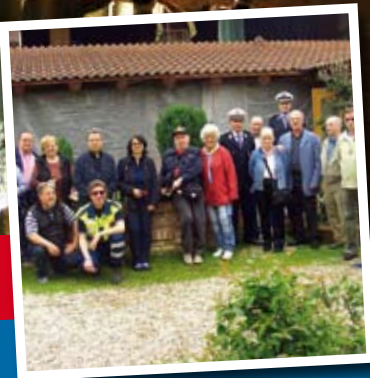
Servizio civico Anziani in Azione