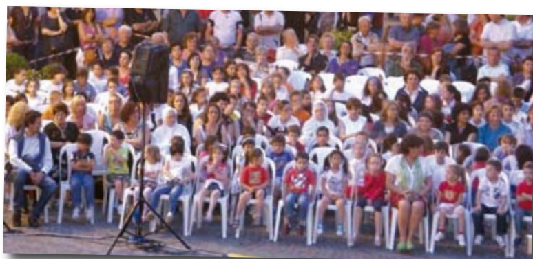
I giovani delle scuole