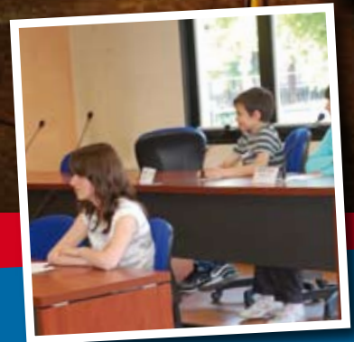
I giovani del CCR