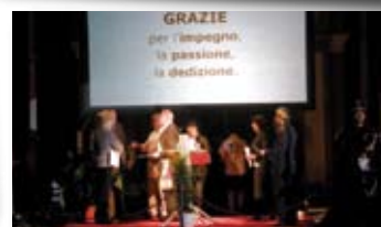
Gli insegnanti in pensione