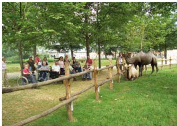
Gita del 10 luglio a Laghi Baite