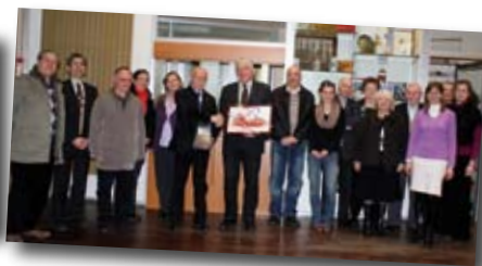
Incontro con Nogent sur Oise