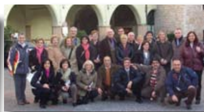
Incontro con Trevi