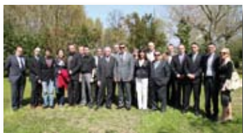
Incontro con Elk

una delegazione di cittadini di Nogent sur Oise, cittadina francese con la quale si vuole avviare un percorso di collaborazione, scambio e confronto per creare nuovi rapporti importanti per il mondo associativo, culturale, sociale ed economico di Orbassano. Questa Città del nord della Francia ha ospitato, nello scorso marzo, una delegazione di Orbassano per un primo incontro di conoscenza. Proseguono inoltre i contatti con la cittadina polacca di Elk, dopo l'incontro dello scorso aprile, a Orbassano, che ha visto la firma di un vero e proprio "Patto di amicizia" tra le due Città.