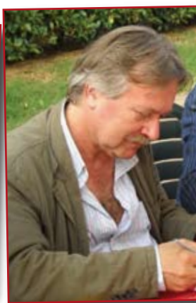
Alcuni momenti della nascita del Presidio Slow Food