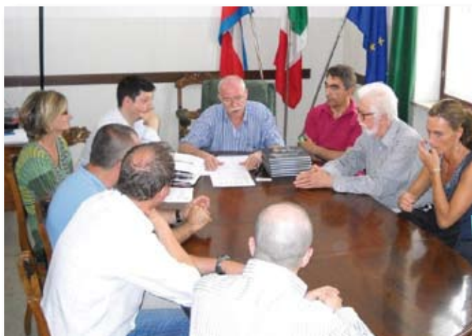
Firma dell'accordo per il progetto a GoromGorom.