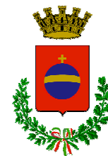
Città di Orbassano