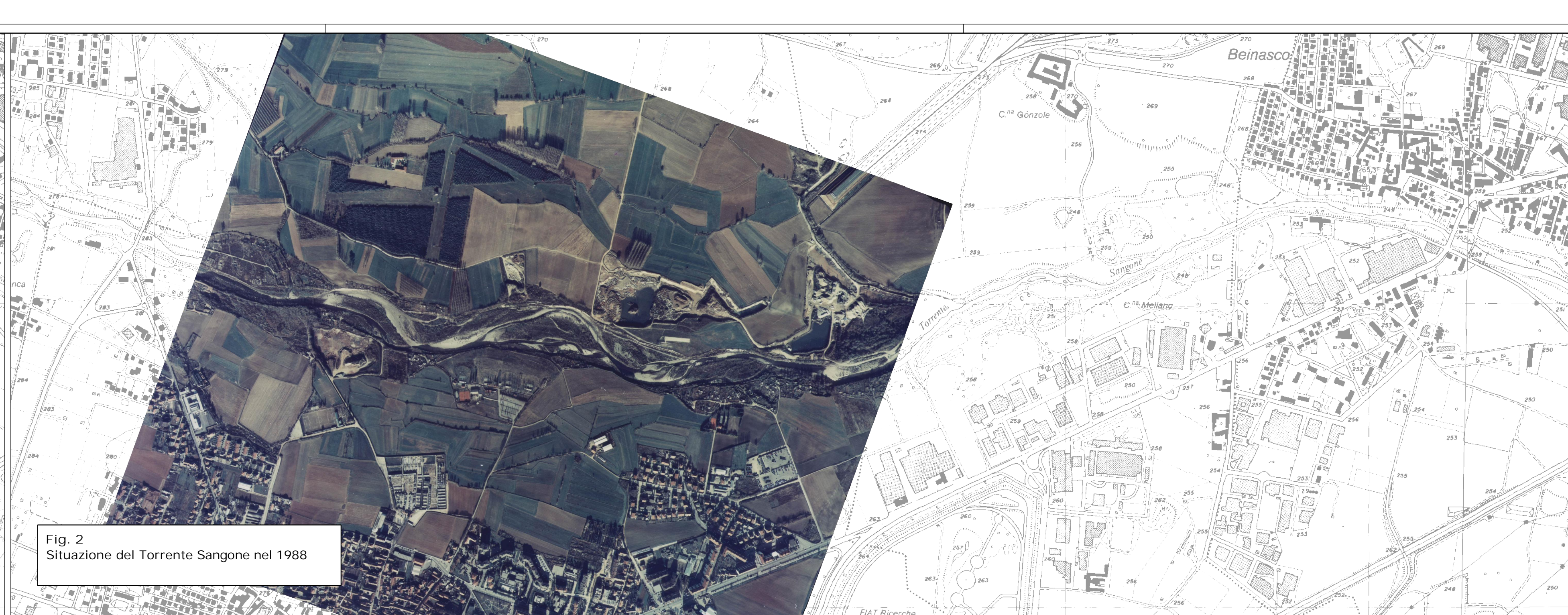
Fig. 2 Situazione del Torrente Sangone nel 1988