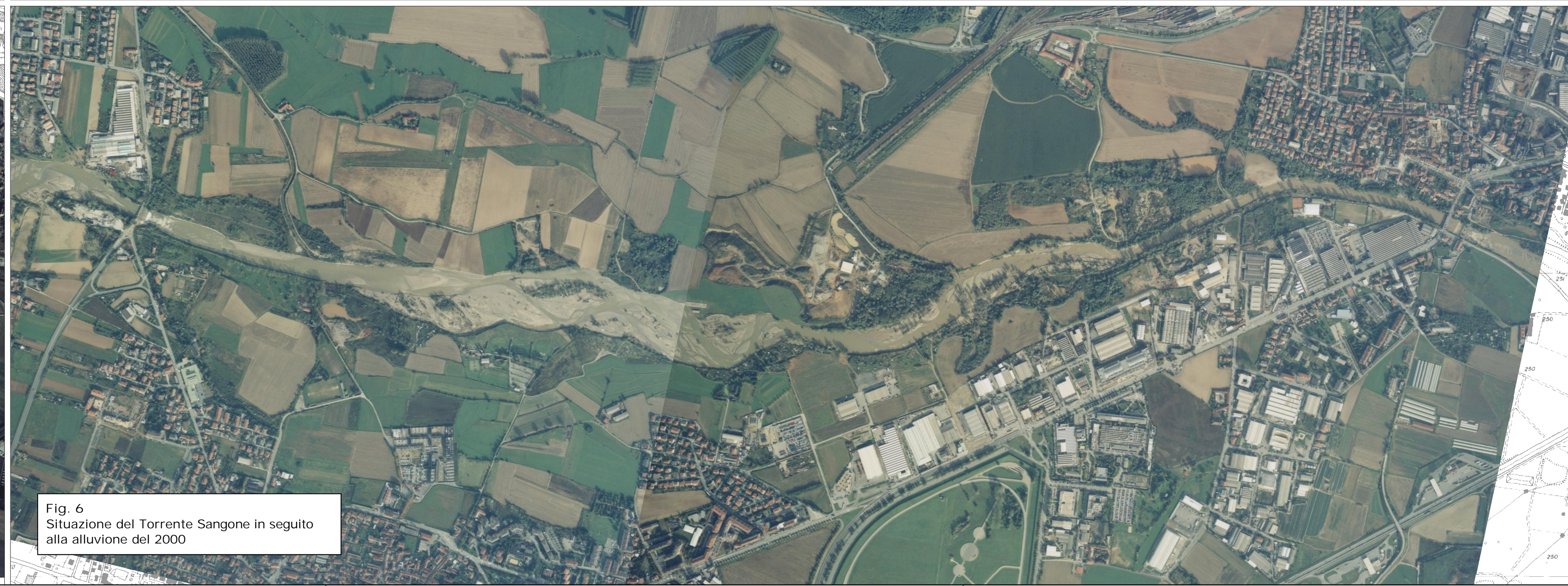
Fig. 6 Situazione del Torrente Sangone in seguito alla alluvione del 2000