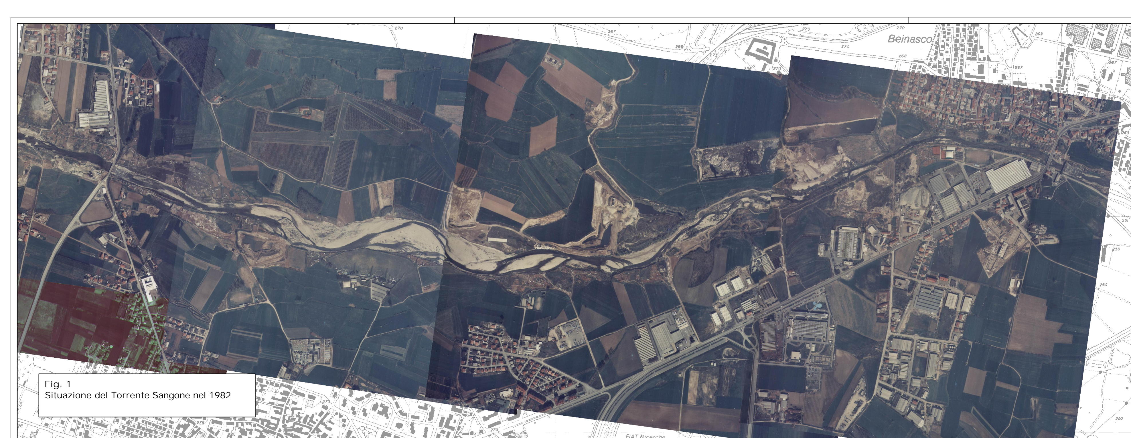
Fig. 1 Situazione del Torrente Sangone nel 1982