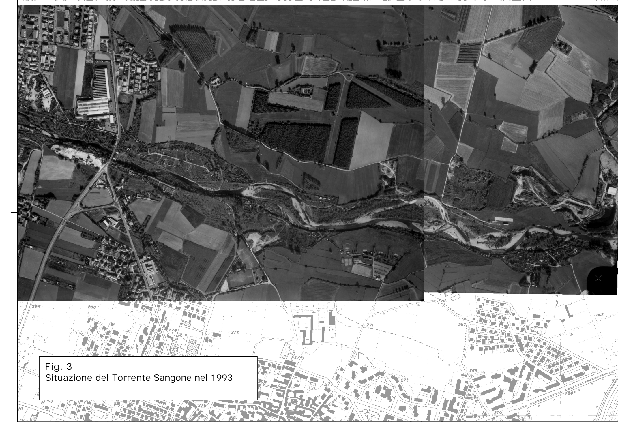
Fig. 3 Situazione del Torrente Sangone nel 1993